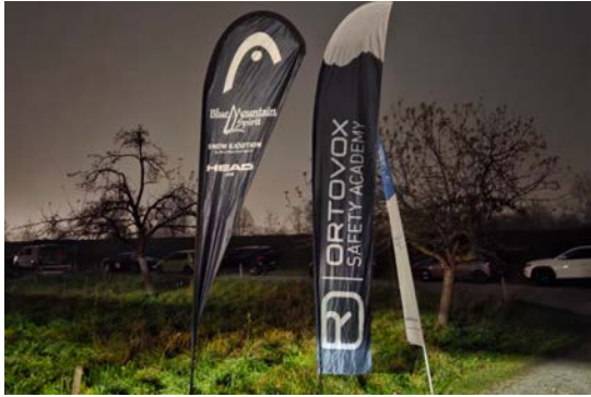
Teamspirit & Vorfreude auf die Wintersaison 2025/2026 07.11.2025

Ein besonderer Abend voller Inspirationen 😊.