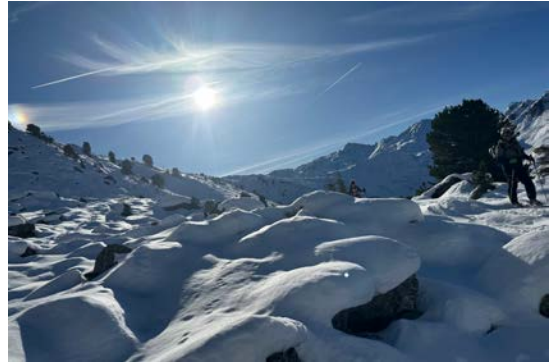
1. Safety-Wochenende im Winter 2025/2026 20./21.12.2025

Weitere Bilder und Infos zu unserem Teamabend findest Du hier!