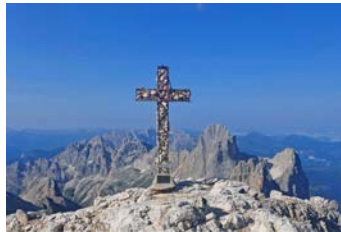
Klettersteige und Wandern im Rosengarten 22.-26.07.2026