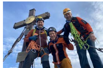
Großglockner mit Bergführer