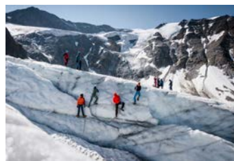
Hochtourenkurs für Einsteiger am Taschachhaus 11.-14.06.2026 Noch 2 Plätze frei! 18.-21.06.2026 23.-26.07.2026 Noch 3 Plätze frei!