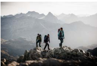
Grundkurs Bergsteigen 05.-07.06.2026 03.-05.07.2026