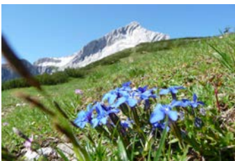
In 4 Tagen durch das Wettersteingebirge mit Besteigung der Zugspitze 09.-12.07.2026