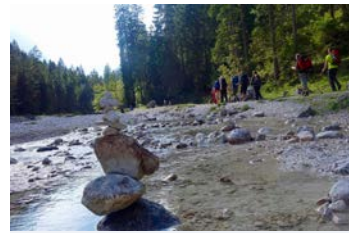
Geführte Wanderung durchs Reintal auf die Zugspitze