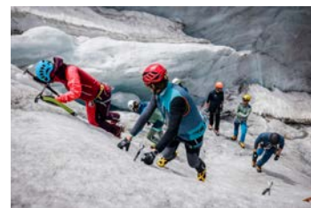
Hochtourenkurs für Fortgeschrittene 11.-14.06.2026