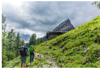
Watzmann - König der Berchtesgadener Alpen

11./12.07.2026 25./26.07.2026 08./09.08.2026