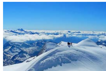
Großvenediger mit Bergführer