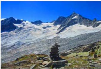
Schwarzenstein mit Bergführer 09.-11.07.2026 06.-08.08.2026