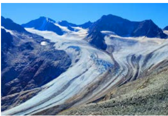
Venter Runde im Sommer 09.-12.07.2026