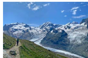
Spaghetti Runde im Monte Rosa Gebiet 06.-11.08.2026