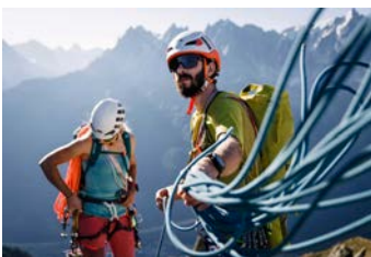
Climbing Basic 16.05.2026

Bereits angebuchte Touren und Kurse findest du hier 😊.