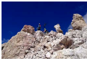
Große Zinne mit Bergführer 04.07.2026